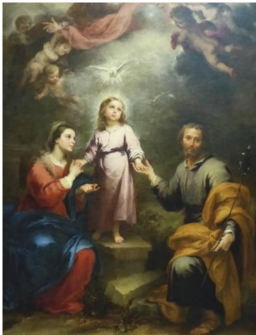
Bartolomé Esteban Murillo, Die himmlische und irdische Trinität (1675-82)

In der irdischen Trinität von Maria, Josef und Jesus – und in jeder Beziehung, die von Liebe geprägt ist – spiegelt sich die göttliche Trinität von Vater, Sohn und Heiliger Geist.